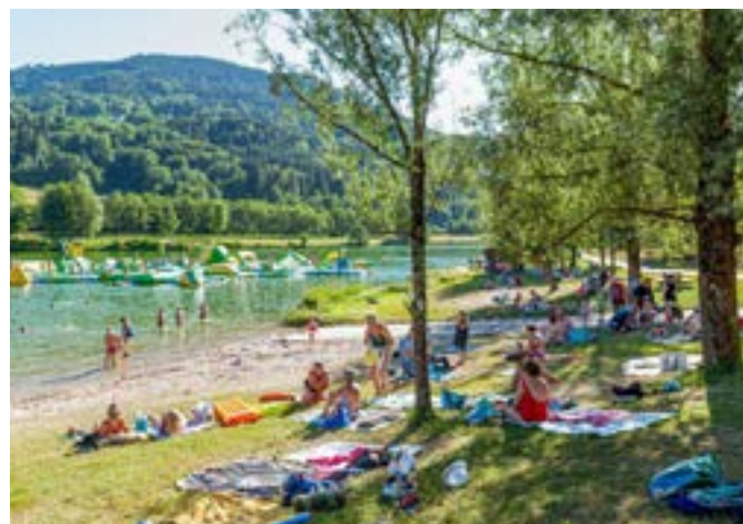
La Moselotte : Plage et activités