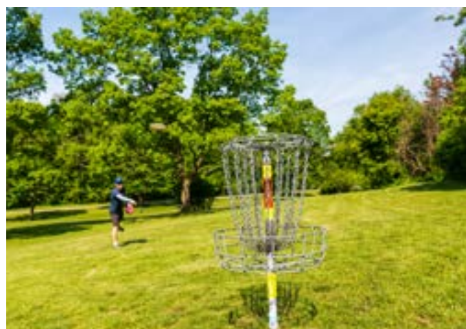
Initiation au Disco golf