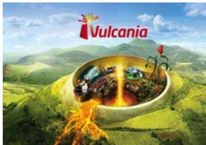
1 journée au Parc Vulcania