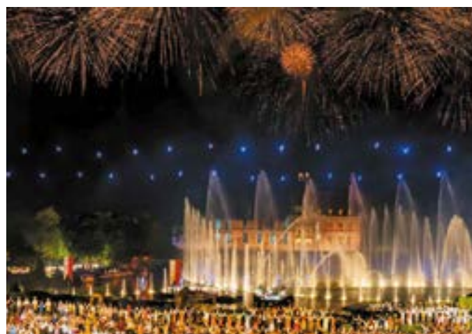
Cinéscénie : Spectacle nocturne