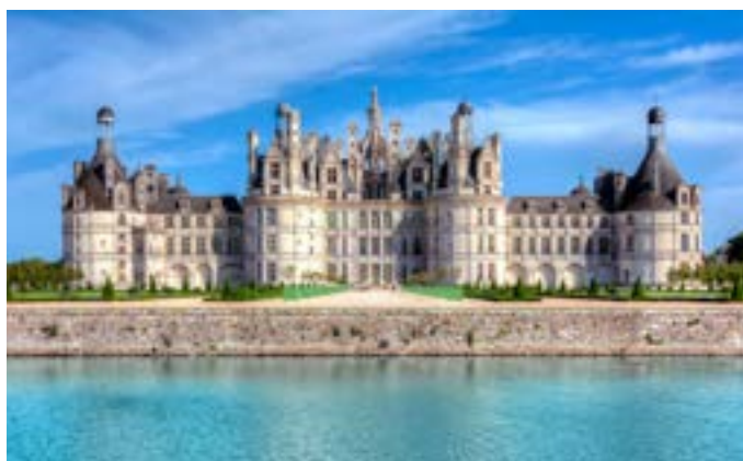
Le château de Chambord