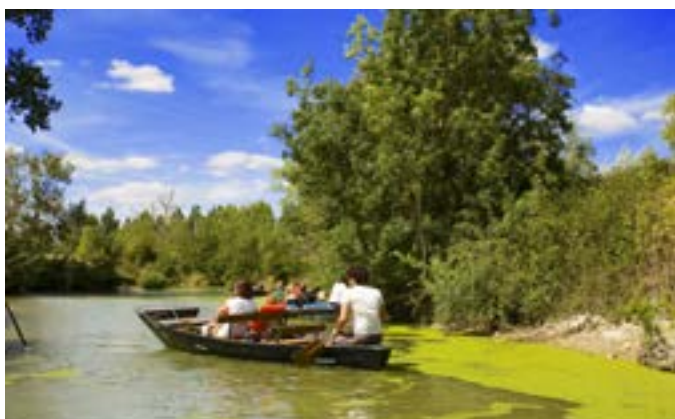
Le Marais Poitevin