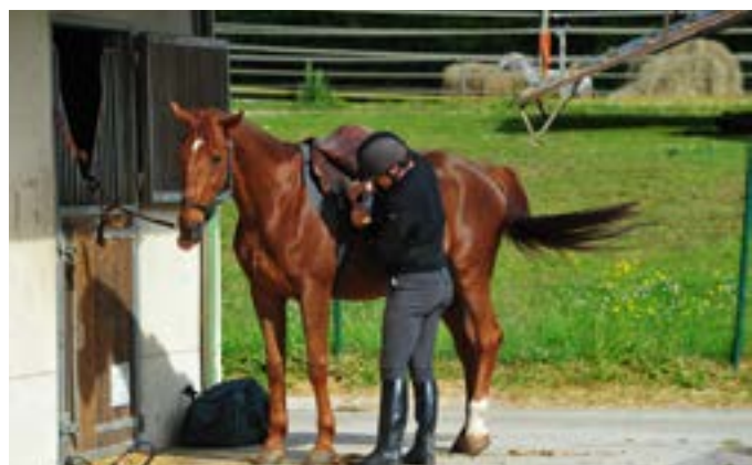
Centre équestre sur place