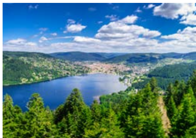
Lac de Gérardmer