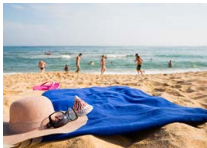
Plage et baignade