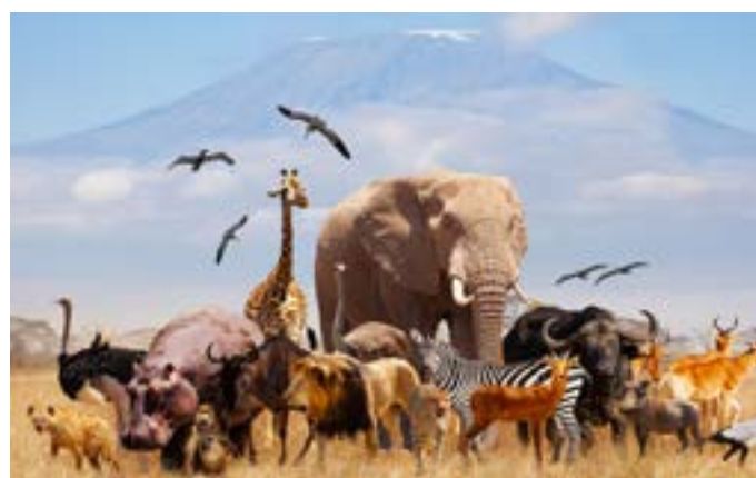
La réserve africaine de Sigean