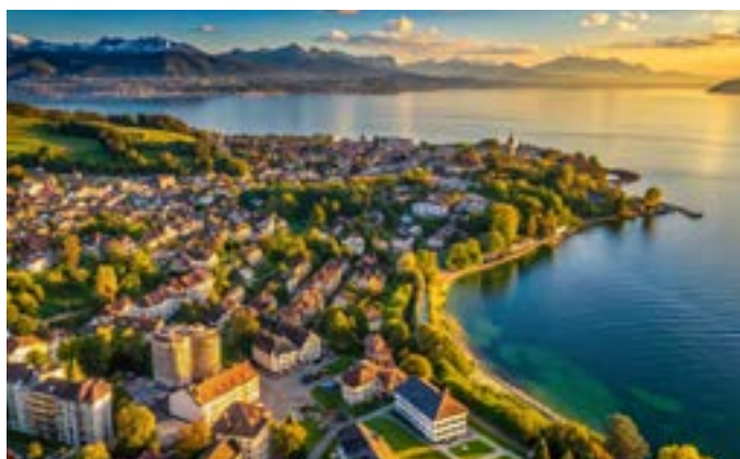
Evian les Bains