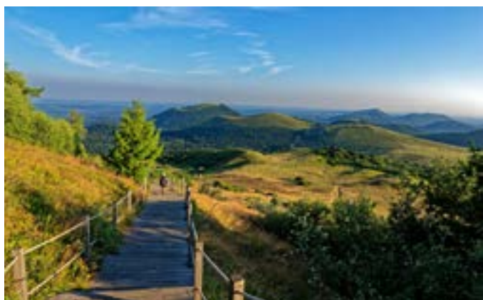
Le Puy de Dôme