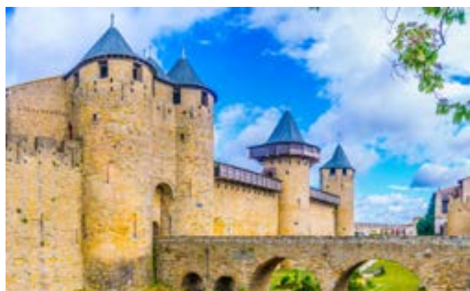
La Cité de Carcassonne