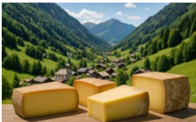
Visite d'une fromagerie