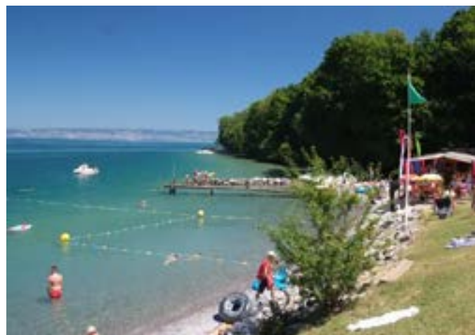
Lac Léman : Baignade et activités