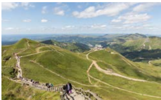
La chaîne des Puys