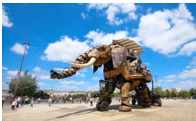
Excursion à Nantes